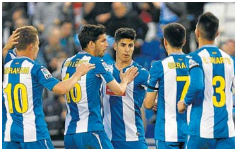
Els jugadors de l'Espanyol afronten una final.

Tres punts semblen suficients per salvar el conjunt blanc-i-blau, però per aconseguir-ho cal una última empenta i posar-se la granota de treball, precisa-