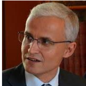
Presidente de FIB Alumni y CIO de Vichy Catalan