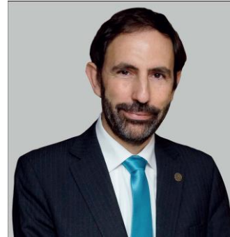
Impulsor y presidente de los COVIDWarriors y tecnólogo