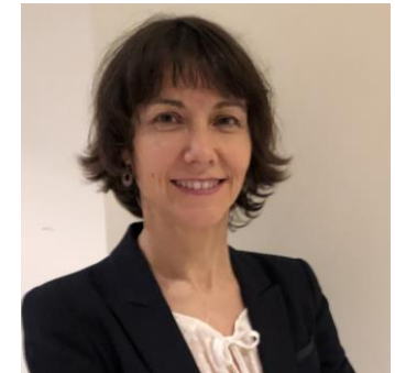
CIO del Hospital Universitario Parc Taulí