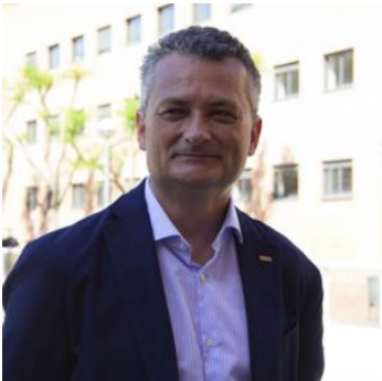
Decano de la FIB