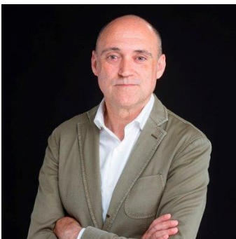
Experto TIC y director general de la ACEC