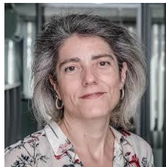
Periodista especializada en las TIC