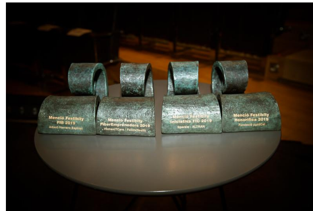
Guardons entregats durant la 17ª Festibity celebrada al TNC el 28 de maig del 2019